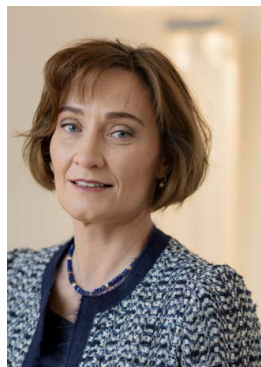
Pascale Baeriswyl , Secretaria de Estado Departamento Federal de Asuntos Exteriores DFAE

Deseo, pues, que todos(as) tengamos mucho éxito en la implementación de este plan de acción.